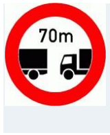
Tabelle: Nichteinhalten des Abstandes von einem vorausfahrenden Fahrzeug in Metern bei einer Geschwindigkeit von mehr als 80 km/h.

Die mit (*) gekennzeichneten Angaben treffen zu, wenn die gemessene Geschwindigkeit mehr als 100 km/h beträgt.