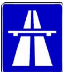
Tabelle: Die wichtigsten Tatbestände im Bezug auf Autobahnen und Kraftfahrtstraßen.