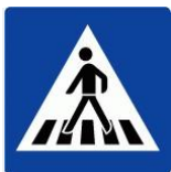
Tabelle: Fehlverhalten am Fußgängerüberweg.