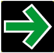
Tabelle: Fehlverhalten beim Rechtsabbiegen mit Grünpfeil.