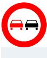
Tabelle: Rechtswidriges Überholen.